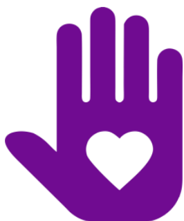
Логотип трека «Орлёнок – Доброволец»

Реализация трека проходит для ребят 1-х классов в начале декабря, но его тематика актуальна круглый год. Важно, как можно раньше познакомить обучающихся с понятиями «доброволец», «волонтёр», «волонтёрское движение». Рассказывая о тимуровском движении, в котором участвовали их бабушки и дедушки, показать преемственность традиций помощи и участия. В решении данных задач учителю поможет празднование в России 5 декабря Дня волонтёра.