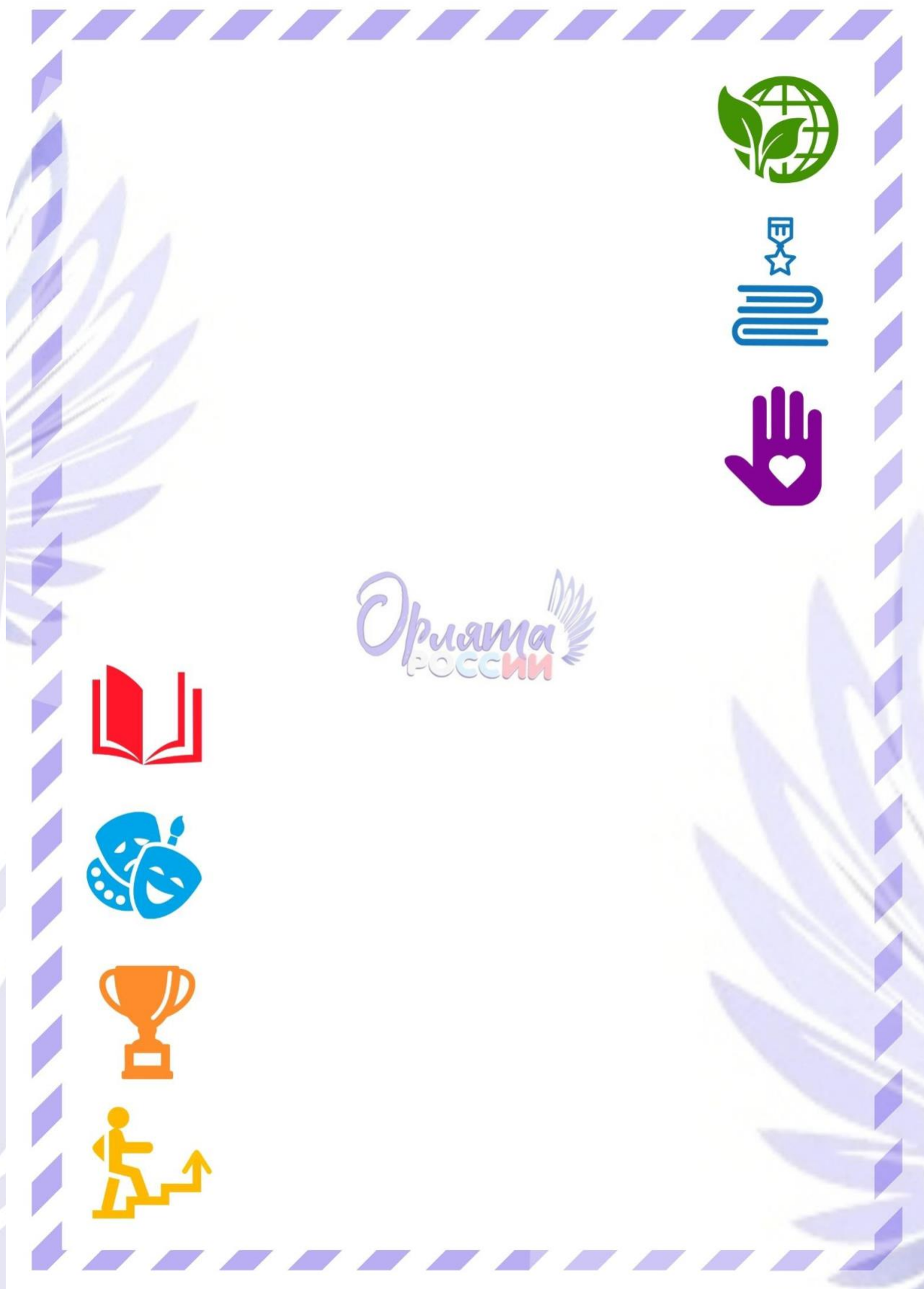
Рис. 2. Обратная сторона «Письма в Будущее».