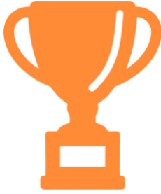
Логотип трека «Орлёнок – Спортсмен»

Ценности, значимые качества трека: здоровый образ жизни